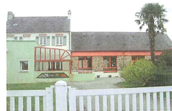
Familles Rurales Bricquebec c'est aussi bien d'autres actions y compris la crèche...

Sorties en familles (festival, concert, visites culturelles...).