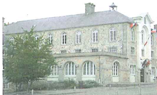
Mairie de Bricquebec

Dans les locaux du centre de loisirs (cf plan).